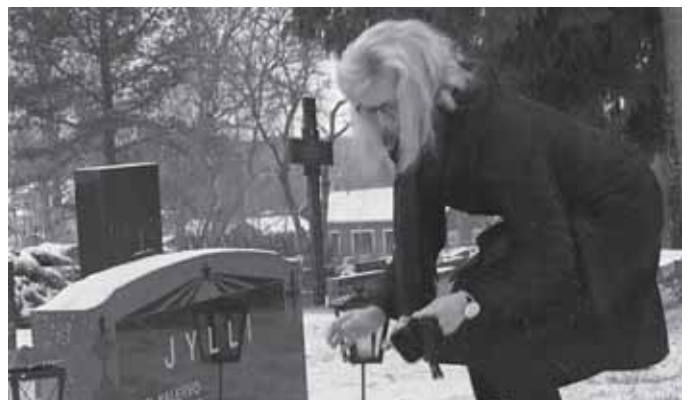
Kuvat Hanna-Mari Ruuska